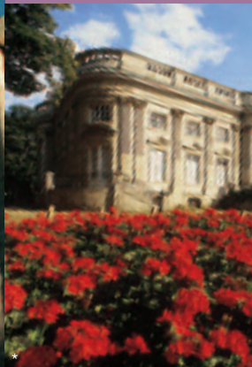
* 照片：Braunschweig Stadtmarketing GmbH/okerland-archiv